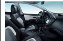
EX opció színvilág (CP1)