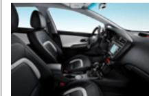
EX opció luxus csomag (CP3)