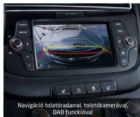
Navigáció tolatóradarral, tolatókamerával, DAB funkcióval