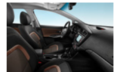
EX opció színvilág (CP2)