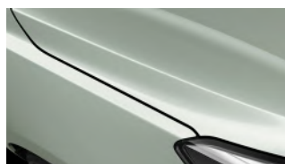
Urban Green (URG)