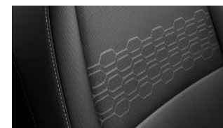
EX fekete szövet