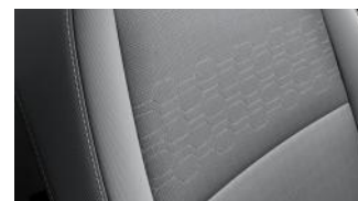
EX szürke szövet