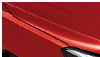
Signal Red (BEG)