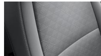
LX szürke szövet