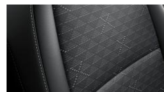
LX fekete szövet