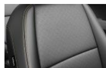
Fekete kéttónusú, fekete/szürke műbőr (Bronz szín-csomag), EX opció