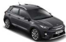
Platinum Graphite (ABT)