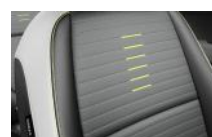
Szürke kéttónusú, fekete/szürke műbőr/szövet (Zöld szín-csomag), EX opció