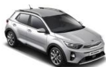
Silky Silver (4SS)