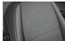
Fekete kéttónusú, fekete szövet, LX széria