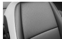
Szürke kéttónusú, fekete/szürke műbőr, EX opció