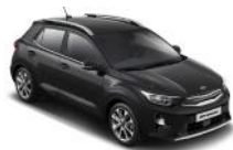
Aurora Black Pearl (ABP)