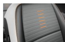
Szürke kéttónusú, fekete/szürke műbőr/szövet (Narancs szín-csomag), EX opció