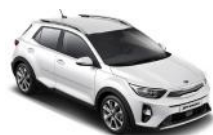
Clear White (UD)