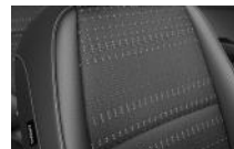
Fekete kéttónusú, fekete szövet, EX széria