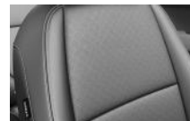
Fekete kéttónusú, fekete műbőr, EX opció