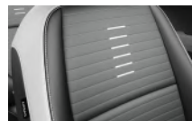
Szürke kéttónusú, fekete/szürke műbőr/szövet (Szürke szín-csomag), EX opció