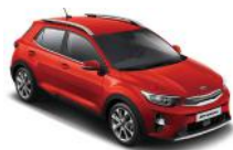
Signal Red (BEG)