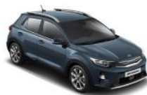
Smoke Blue (EU3)