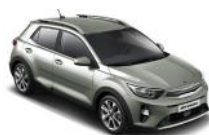
Urban Green (URG)