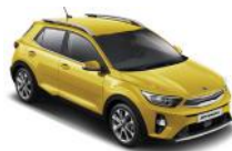
Most Yellow (MYW)