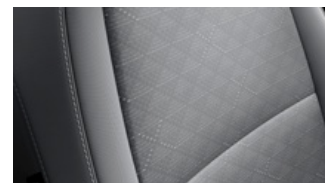
LX szürke szövet