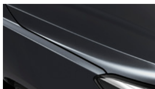
Platinum Graphite (ABT)