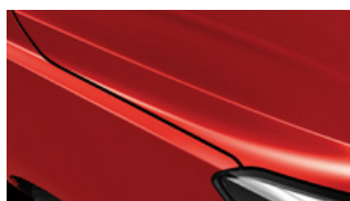
Signal Red (BEG)