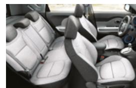
ECO kettónusú szürke szövet