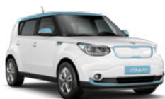
Snow White Pearl + Electronic Blue