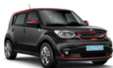
Cherry Black + Inferno Red