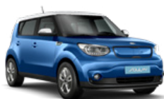
Caribbean Blue + Clear White